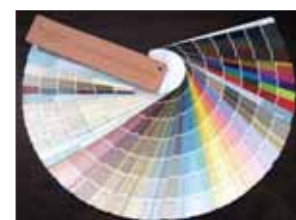
カラースタジオコレクション

※特注色の作成には別途調色料¥2,500~がかかります。 ※塗布面積は下地等により異なります。・出荷証明書を発行いたします。 ※為替の変動により予告なく価格を変更する場合があります。 ※価格は税抜表示です。また別途送料を申し受けます。