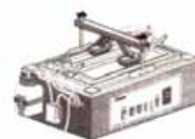
スクラブテスト 専用の機器を使いワイヤーブラシ で200回往復する摩耗テスト